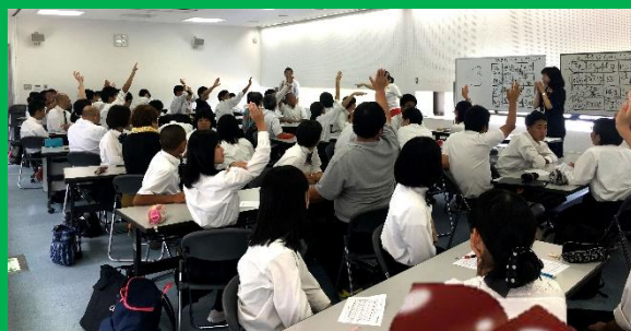
自分のわくわくエンジンを発表しようと手を上げる江津高校生

江津高校のキャリア教育では、そのきっかけを提供し、みなさんのように将来、地域社会の持続的な発展に貢献しようとする人を育てることを目的としています。